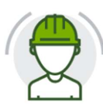
ISO 45001 Gestione sicurezza