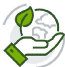
ISO 14001 Gestione ambientale