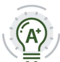
ISO 50001 Gestione energia