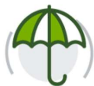
Assistenza Tecnica RSPP