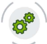
Rischio macchine e impianti