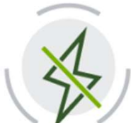
Rischio Elettrico, Atex