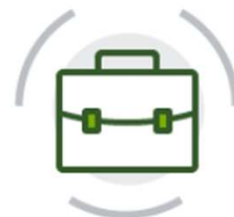
UNI TR 11542 World Class Manufacturing

In coerenza con i nostri valori aziendali, la nostra scelta professionale è stata quella di offrire ai nostri clienti esclusivamente la certificazione dei sistemi di gestione maggiormente focalizzati sui temi dell'efficienza, del controllo dei processi e della sostenibilità sociale dell'impresa.