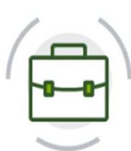
Energy Manager EGE