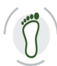
LCA e Carbon Footprint