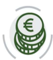
Forniture e Tariffe energia