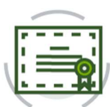
ISO 9001 Gestione qualità