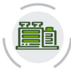
SISTEMI DI GESTIONE QUALITÀ