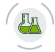
Rischio chimico, cancerogeni