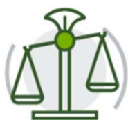
Valutazione dei rischi